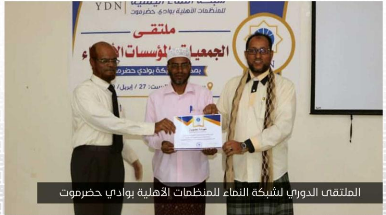
الملتقى الدوري لشبكة النماء للمنظمات الأهلية بوادي حضرموت