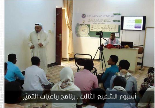
أسبوع الشفيع الثالث. برنامج ربايعات التميز