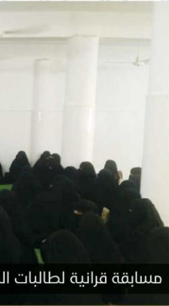
مسابقة قرآنية لطالبات الـ