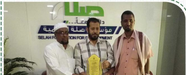
الأمين العام ومسؤول العلاقات يكرمان مدير صلة للتنمية