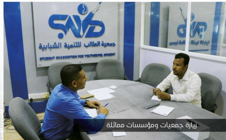
زيارة جمعيات ومؤسسات مماثلة