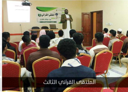
الملتقى القرآني الثالث