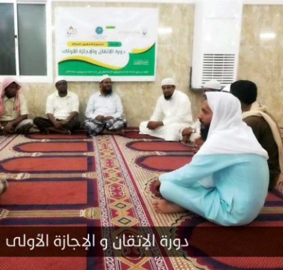
دورة الإتقان و الإجازة الأولى