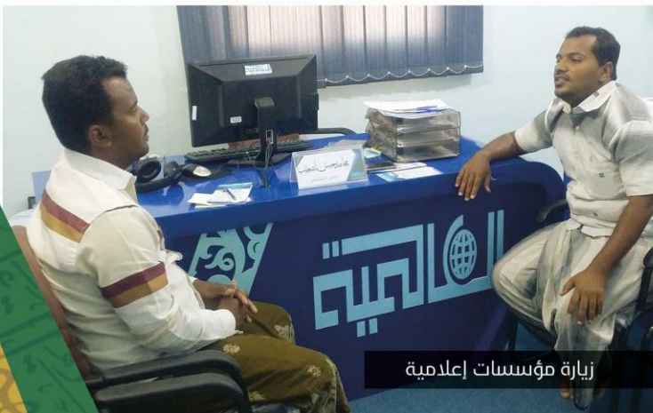
زيارة مؤسسات إعلامية