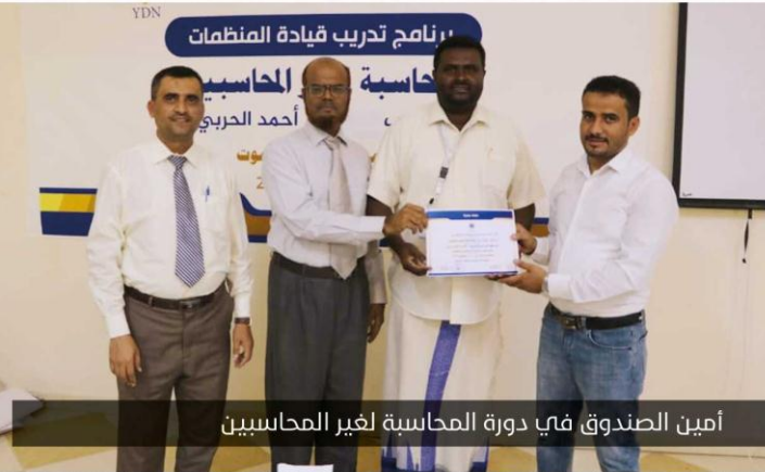
أمين الصندوق في دورة المحاسبة لغير المحاسبين