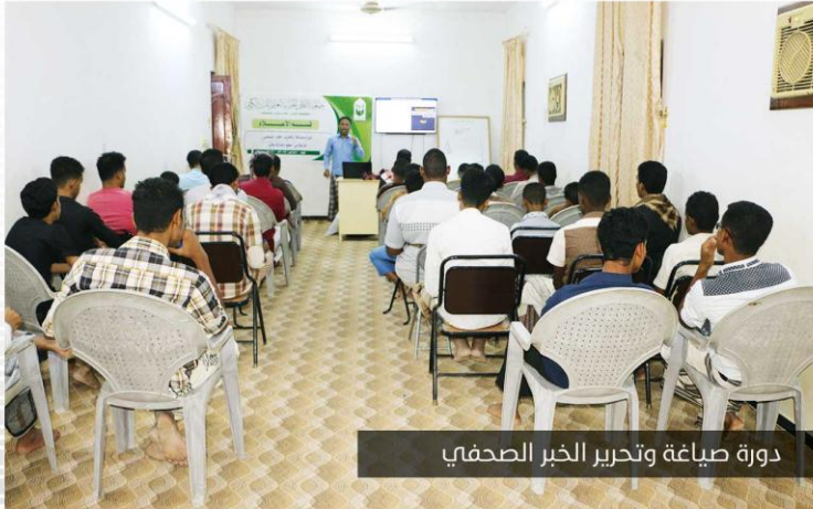
دورة صباغة وتحرير الخبر الصحفي