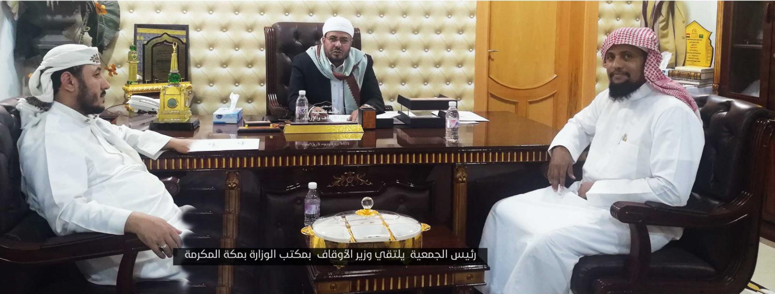
رئيس الجمعية يلتقي وزير الأوقاف بمكتب الوزارة بمكة المكرمة