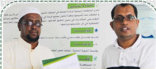
توقيع مذكرة تفاهم مع مؤسسة البادية للتنمية والأعمال الإنسانية