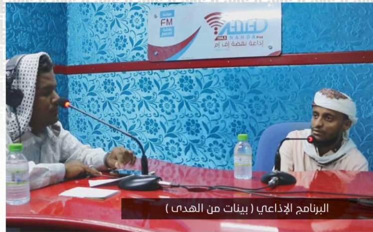
البرنامج الإذاعي (بينات من الهدى)