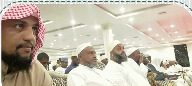
حضور رئيس الجمعية مؤتمر ( هذا الكتاب ) بدار السلام بتنزانيا