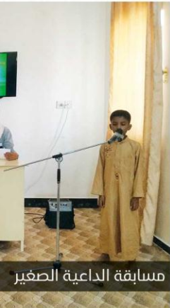
مسابقة الداعية الصغير