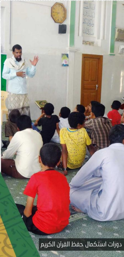
دورات استكمال حفظ القرآن الكريم