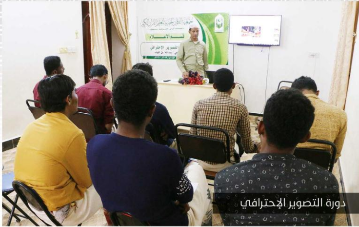
دورة التصوير الاحترافي