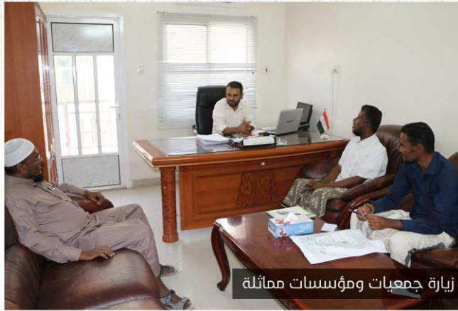
زيارة جمعيات ومؤسسات مماثلة