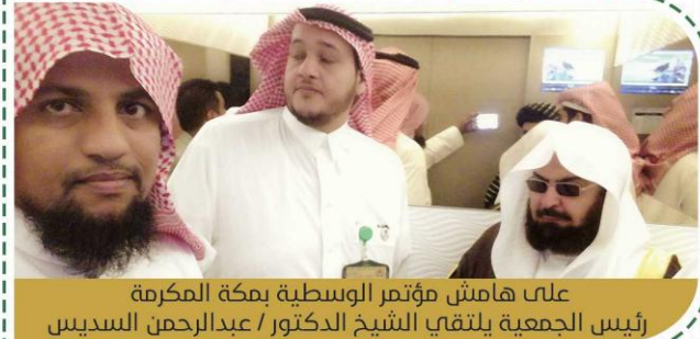
على هامش مؤتمر الوسطية بمكة المكرمة رئيس الجمعية يلتقي الشيخ الدكتور / عبدالرحمن السديس