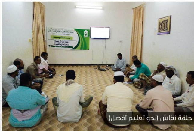
حلقة نقاش (نحو تعليم أفضل)